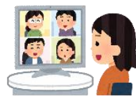
双方向の オンライン学習