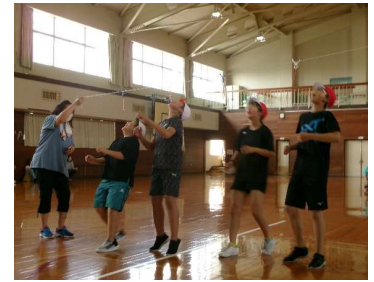
6年生：パン食い競争

全学年の様子をお伝えしたかったのですが、代表で6年生の写真を掲載します。他の学年の様子につきましては、学校ホームページに載せていますのでご覧ください。