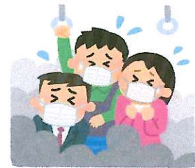
混雑した乗り物の中