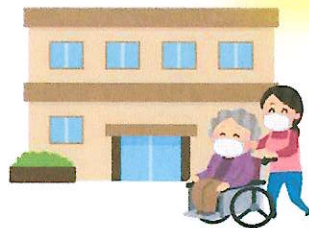
高齢者施設など に行くとき