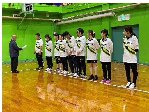
準優勝のCクラスのみなさん