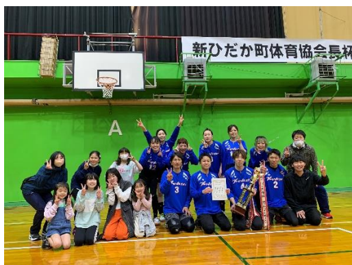
Bクラス優勝のみなさん

5月21日(日)、町立体育館にて「第17回新ひだか町スポーツ協会長杯争奪お父さんお母さん混合バレーボール大会」が行われ、高静小学校からはBクラスとCクラスに1チームずつが出場しました。目が覚めるような強烈なスパイクが飛び交い、白熱したラリーの応酬が続くハイレベルな試合を勝ち抜き、Bクラス優勝、Cクラス準優勝という好成績を収めました。出場された選手の皆さん、応援に駆けつけてくださった方、練習の計画や当日の運営に当たってくださったPTA保体委員会の皆さん、すべての方々にこの場をお借りして感謝いたします。ありがとうございました。