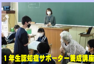
1年生認知症サポーター養成講座