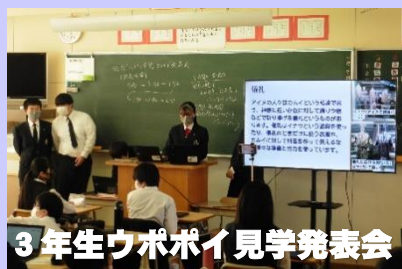
3年生ウポポイ見学発表会

2年生は、11月18日（金）に『オンラインインタビュー』を実施しました。地域の事業所のご協力を得て、オンライン上で数々の職場と繋がりました。働くことの意義や自分の将来について考え、社会的なルールやマナーを学ぶことができました。