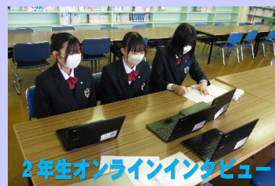
2年生オンラインインタビュー