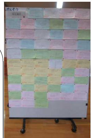
【寄せられた感想の数々】