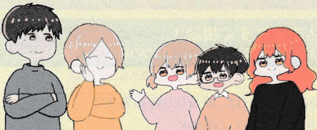
イラスト：愛知工業大学 大学生サイバーボランティア

裏面では、実際にインターネット利用によって子供たちに起きた犯罪やトラブルをご紹介します。